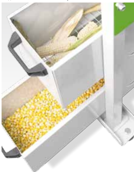
Лотки для зерна и стержней