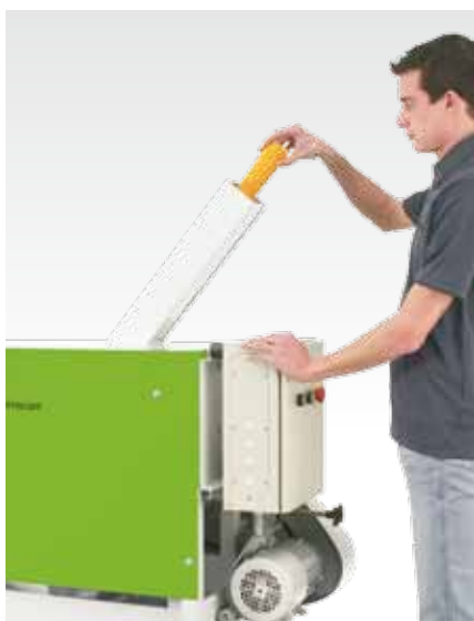
Подача початков в молотилку