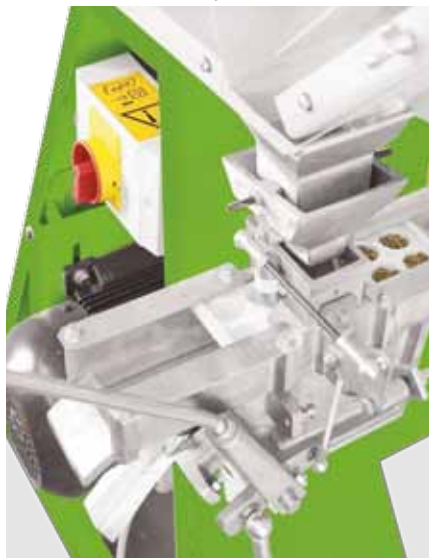
Устройство для наполнения кассет (опция)