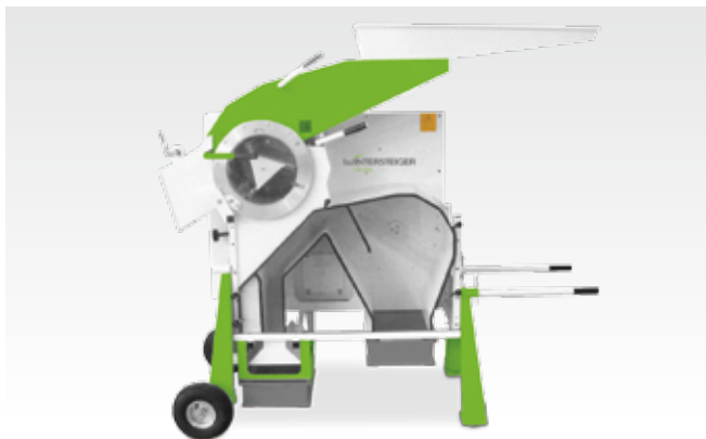
На двух колёсах

Варианты для передвижения и транспортировки WINTERSTEIGER LD 350: