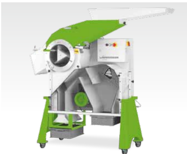
На четырёх колёсах