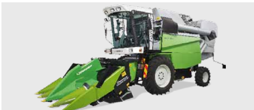
Селекционный комбайн Split

Колосовые молотилки, кукурузные молотилки, машины для влажного протравливания, измельчители зеленой массы, делители образцов семян