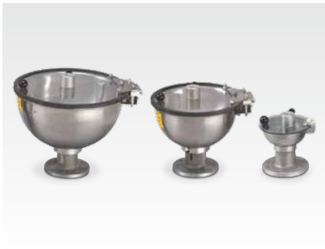
Рабочие ёмкости: маленькая - средняя - большая