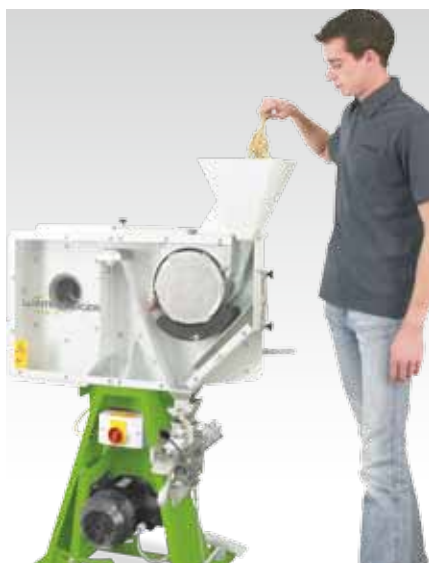
Подача колосков в молотилку