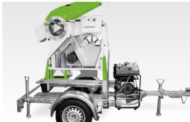
С одноосным легковым прицепом