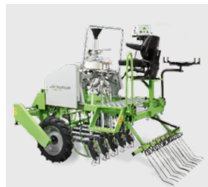
Сеялка сплошного посева Plotseed S