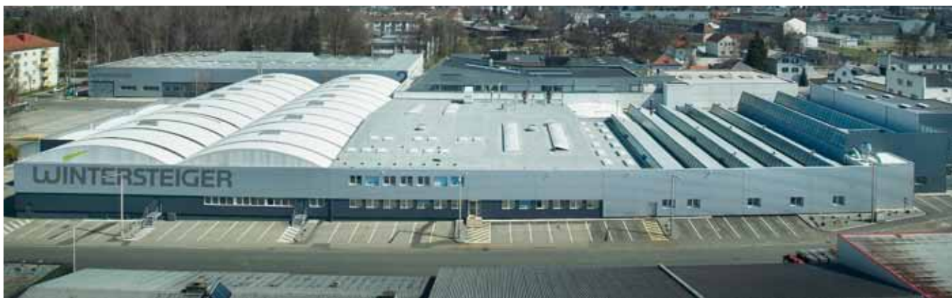
Главное предприятие концерна в г. Рид-им-Иннкрайс (Верхняя Австрия)