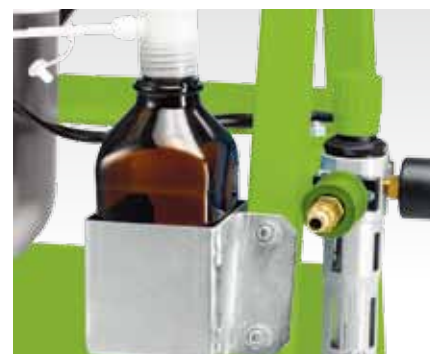
Диспенсетта с бутылкой из коричневого стекла