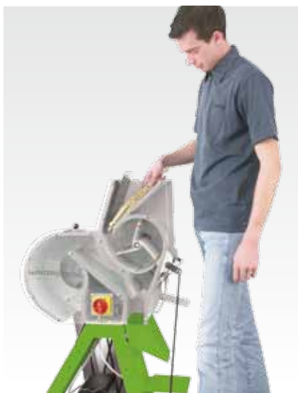
Подача колосков в молотилку