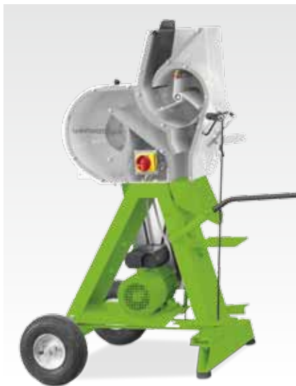
LD 180 на колёсах