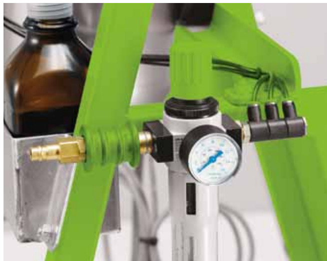
Опция: устройство для продувки