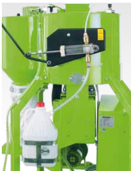
Насос - дозатор